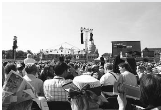
Weitere Impressionen aus den Kirchentag in Dresden.

Auch werde ich ihm die letzten beiden Ausgaben der Richtung zu senden.