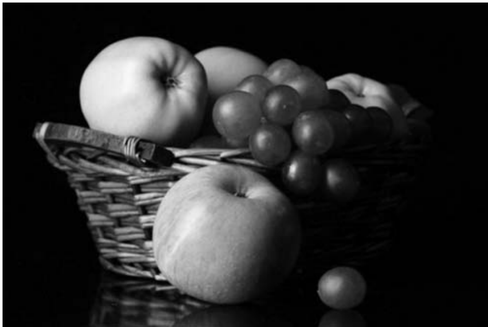
Erntezeit ist da.

Bunt sind schon die Wälder, Gelb die Stoppelfelder; Und der Herbst beginnt. Rote Blätter fallen; Graue Nebelwallen; Kühler weht der Wind.