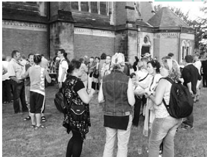
Austausch in der Gehörlosengemeinschaft.

Dieser Brief ist leicht gekürzt, die angesprochenen Freunde dürfen den Brief gerne einsehen.