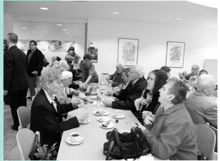
Nach dem Gottesdienst ... Kaffee!