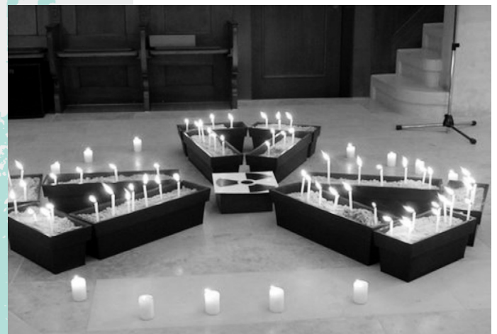
Fürbitten für Japan.