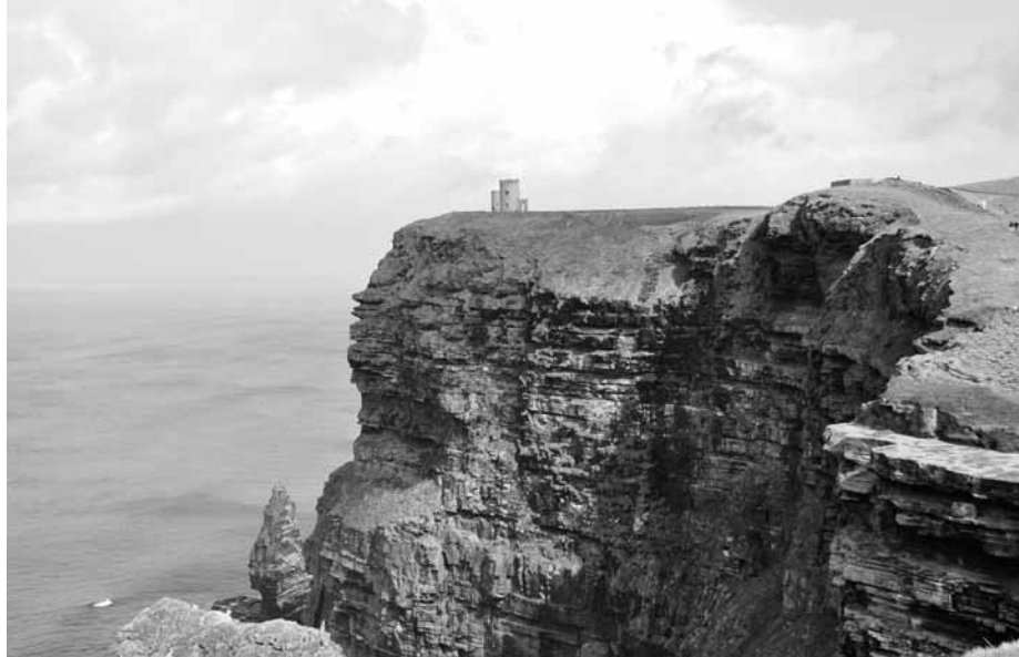
Cliffs of Moher.