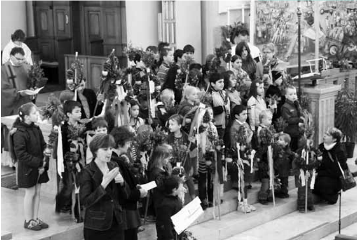
Kinder mit Palmstöcken