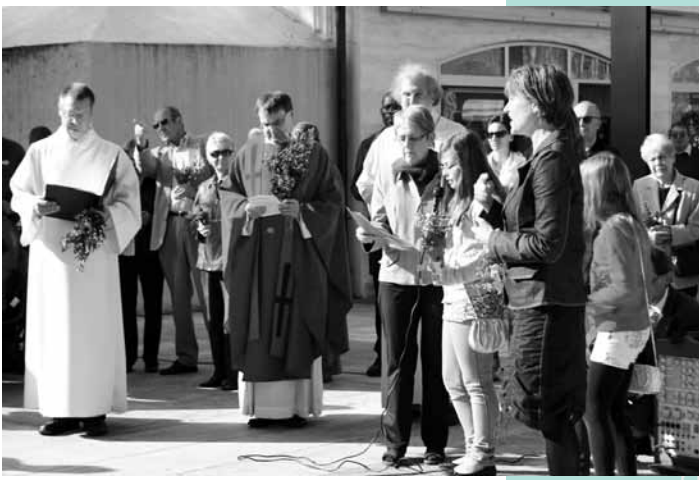
Vorplatz St. Agatha, Dietikon