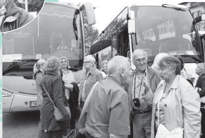
"Hast du alles gesehen?"