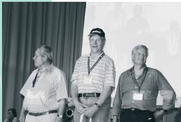
Lossieger – ein Schweizer dabei!