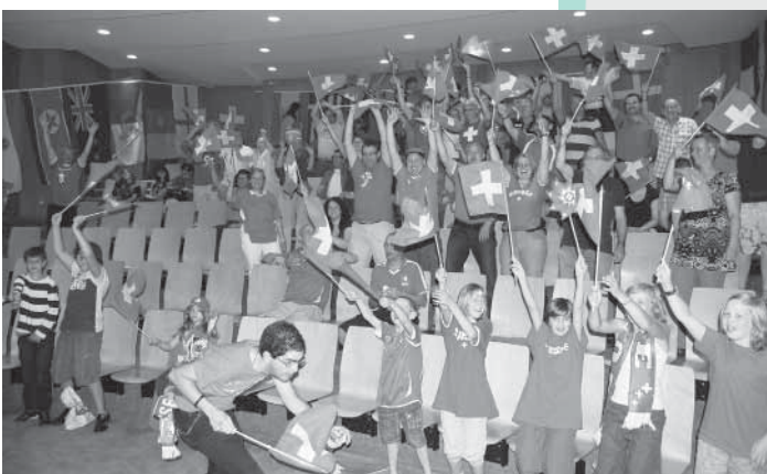
Begeisterung kennt keine Grenzen