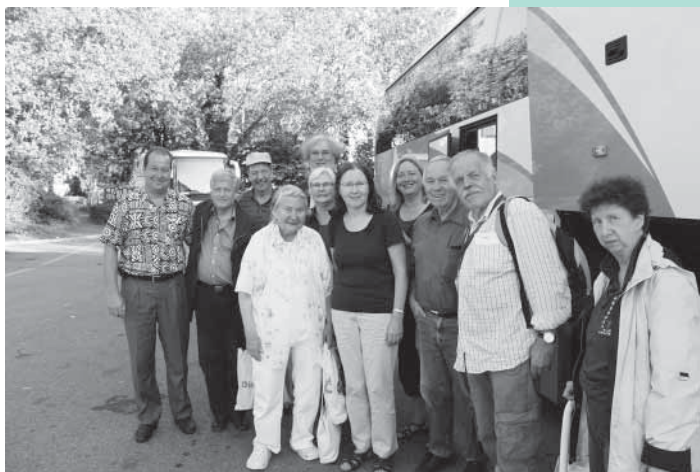
“Ökumene” auf Reisen – gut gelaunt!

Sonntag, 18. Juli, Ehningen, Baden-Württemberg, Deutschland