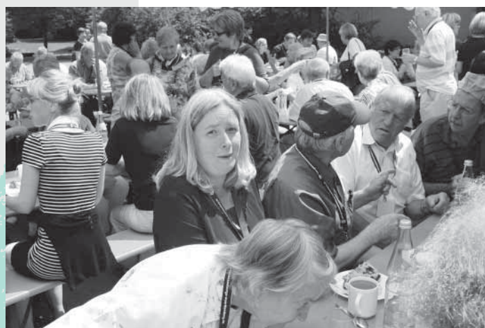
Gut geschmeckt ...