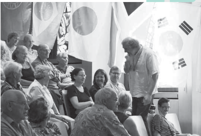
Fussballstudio im Gottesdienst.