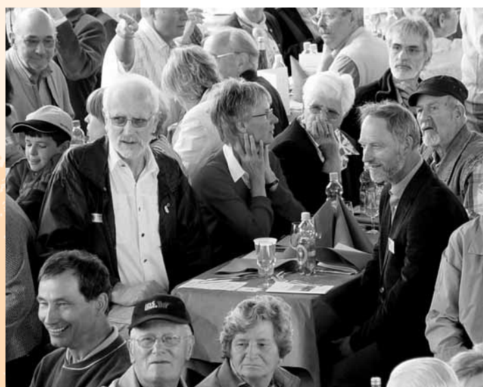
Bildergeschichte ohne Worte auf den Seiten 4 bis 6

Sabine Rüthemann ist Informationsbeauftragte des Bistums St. Gallen.